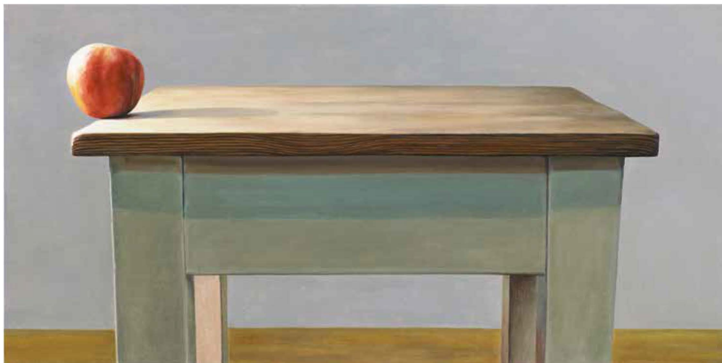
Karen Holländer: „Gratwanderung“, 2015. Öl auf Leinwand, 40 x 80 cm (Courtesy Galerie bechter kastowsky/Foto: Daniela Beranek)